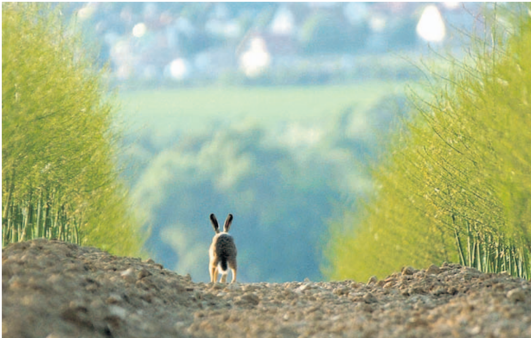
Wer in Winterthur einen Hasen übers Feld laufen sieht, darf sich glücklich schätzen. Die scheuen Tiere sind rund um die Stadt nämlich selten geworden.

Geschossen werden Hasen im Kanton Zürich nur noch selten, sie sind zwar nicht geschützt, die allermeisten Jäger verzichten aber freiwillig darauf, das selten gewordene Tier zu erlegen. 2011 waren im Kanton neun Feldhasen geschossen worden.